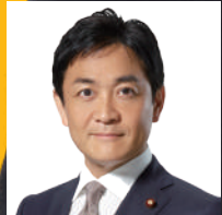
代表 玉木 雄一郎