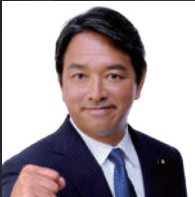
幹事長 榛葉 賀津也