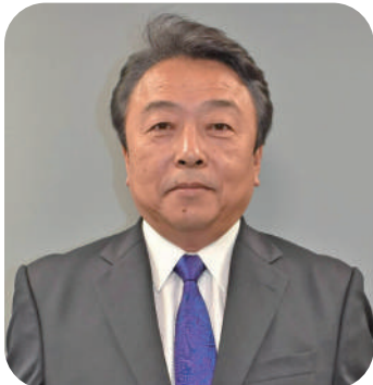
県連代表 衆議院議員 (14区)