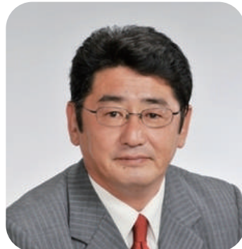
県連幹事長 熊谷市議会議員